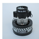
motore bistadio 1300 w max